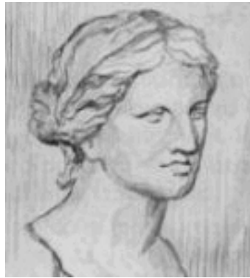
Figura 5. Teano de Crotona

A pesar de que en la Escuela pitagórica también estudiaban otras mujeres, como se acaba de comentar, Teano, nacida en Crotona, en el s. VI a.C., más concretamente en el año 546, es para muchos autores la primera mujer matemática de la antigüedad .