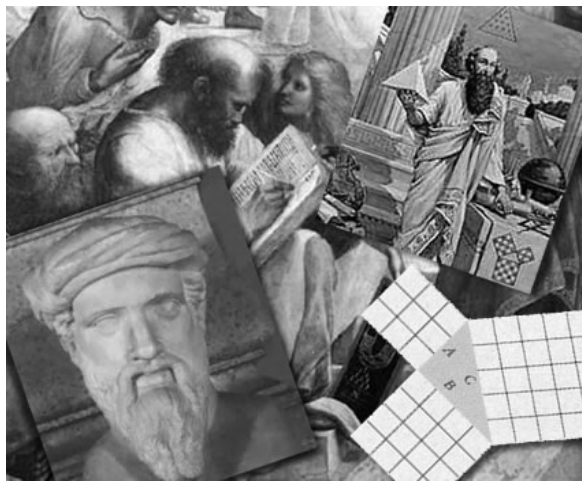
Figura 2. La Escuela Pitagórica