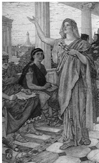
Figura 6. Teano enseñando en la Escuela

Teano fue considerada un modelo de mujer, madre, esposa y filósofa para las demás mujeres; escribió numerosos tratados sobre matemáticas, física y medicina y fue precursora de la investigación científica.