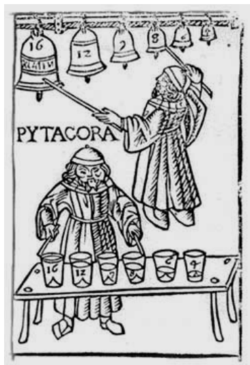
Figura 3. La Música en la Escuela Pitagórica

También, el que los pitagóricos considerasen al número como el principio de todas las cosas, les permitió relacionar la Música con las Matemáticas. Para ello, jugaron con las medias aritméticas , geométricas y armónicas de números, que conocían igual que sus proporciones, lo que les permitía reducir la Música a números.