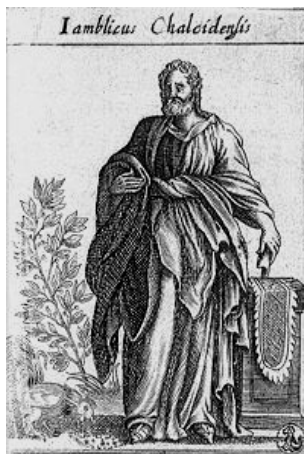
Figura 4. El filósofo e historiador Jámblico.

mujeres, no distinguiéndose entre formación masculina o femenina, dándosele gran importancia a la formación intelectual de las mujeres, aunque eso sí, de alta estirpe y vinculadas a familias de aristócratas que pudieran permitirse. De este modo, como veremos a continuación, puede encontrarse un amplio círculo de mujeres en esta Escuela dedicadas a la ciencia y a la contemplación intelectual. Este hecho es en parte conocido gracias al filósofo e historiador sirio neoplatónico Jámblico, uno de los principales personajes a los que se les debe el conocimiento que se tiene actualmente de la vida y descubrimientos de Pitágoras y su Escuela.